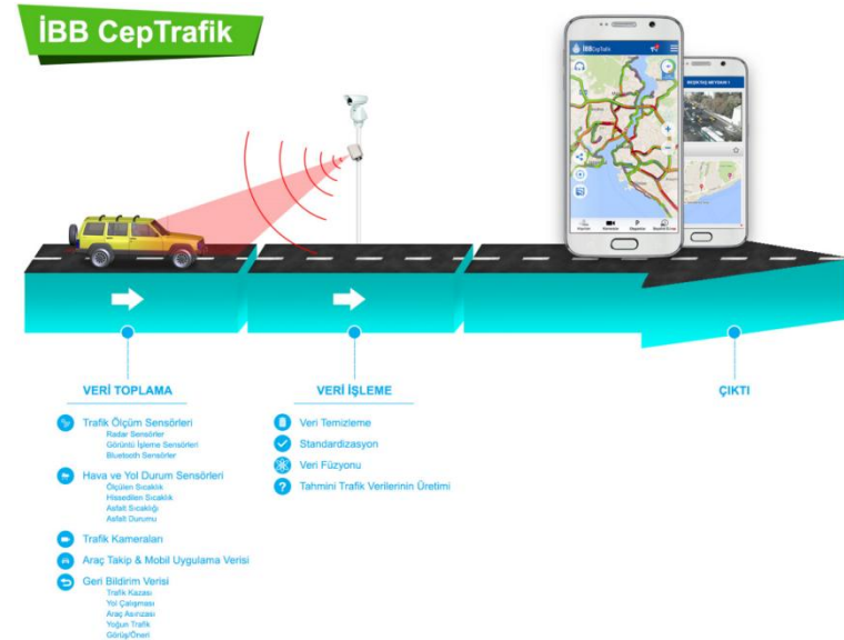
Şekil 1: İBB CepTrafik Hız Verisi Üretimi Süreci

Şekil 1'de, İBB CepTrafik anlık hız verisi üretme sürecine ait akış diyagramı görülmektedir.