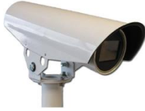
Resim 9: Autoscope AIS –IV Kamera

Görüntü işleme sensörlerinden trafik ölçüm verisi elde edebilmek için, sensöre takılan kameranın bakış açısında kalan alanda sanal şeritler oluşturulmakta (Bknz: Resim 10) ve bu sanal şeritlerden geçen araç sayıları, ortalama hız, işgaliyet ve uzunluğa göre araç sınıfı değerleri toplanarak, sunucuya kaydedilmektedir. Kaydedilen ham veriler (Bknz: Resim 11), sunucuda çalışan görüntü işleme sensörü analiz yazılımı ile yorumlanarak (Bknz: Resim 12) veritabanına aktarılmaktadır.