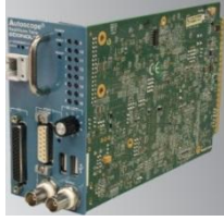
Resim 8: Autoscope RackVision Terra

Kent genelinde yaygın olarak kullanılan radar sensörlerin yanında, ana yollarda ve kent içi karayolu tünellerinde kullanılan ve görüntü işleme teknolojisi ile trafik ölçüm verisi üreten sensörlerden [4] (Bknz: Resim 8) elde edilen veriler de İBB CepTrafik'te kullanılmaktadır. Bu sensörlere bağlı bulunan kameralardan (Bknz: Resim 9) elde edilen canlı görüntüler, görüntü işleme sensörü tarafından analiz edilmekte ve elde edilen bilgiler Trafik Kontrol Merkezi'ne kablolu veya kablosuz ağ üzerinden iletilerek, sunucularda çalışan yazılım ile anlamlı hale getirilmekte ve kullanılmak üzere veritabanı sunucusuna kaydedilmektedir.