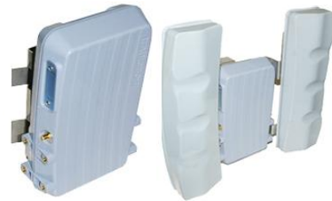
Resim 13: Bluetooth Sensörler

Son yıllarda bluetooth özellikli araç navigasyon kitlerinin, telefonların, kulaklıkların yaygın kullanımı ile birlikte, anonim bluetooth ID'lerinin takip edilerek noktadan noktaya seyahat süresi hesaplaması birçok ülkede kullanılmaya başlanmıştır. İstanbul Büyükşehir Belediyesi kent geneli ana arterlere yerleştiği Bluetooth Sensörler (Bknz: Resim 13) [5] ile sensörler arası seyahat sürelerini ve ortalama hız bilgilerini hesaplayarak, İBB CepTrafik'te trafik ölçüm ve seyahat süresi verisi olarak kullanılmaktadır.